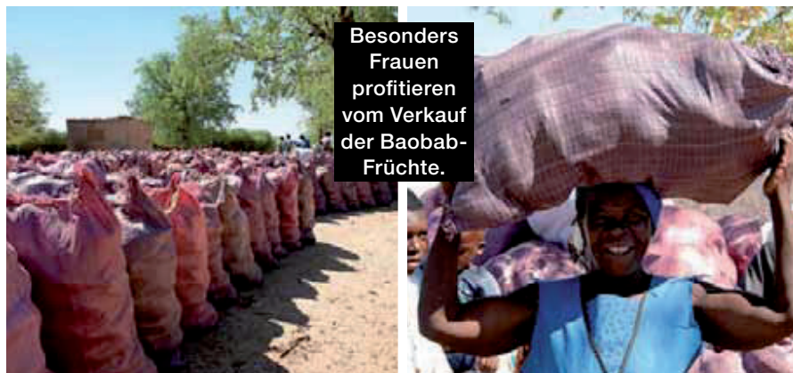
Besonders Frauen profitieren vom Verkauf der Baobab-Früchte.

Bis zur Vermarktung des Pulvers auf Augenhöhe ist es ein weiter Weg. Die Landbevölkerung verfügt kaum über