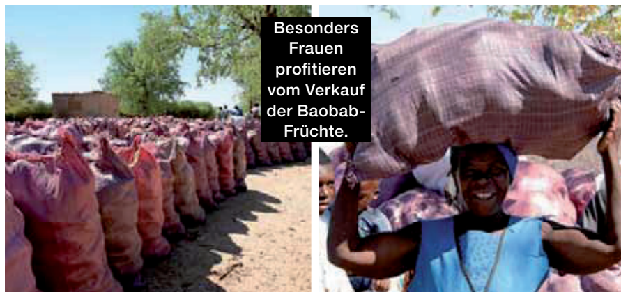
Besonders Frauen profitieren vom Verkauf der Baobab-Früchte.

Bis zur Vermarktung des Pulvers auf Augenhöhe ist es ein weiter Weg. Die Landbevölkerung verfügt kaum über